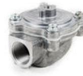
Luftstyrd ventil med gänga