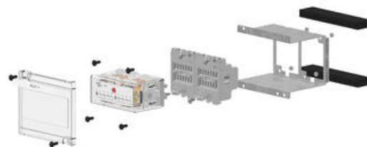
Bild 5 visar en storlek 4 enhet ihopsatt och monterad på rackets topp och botten skenor.